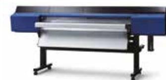
DU2-64 [für VG2-640] Stromversorgung AC 100 bis 120 V ±10 %, 5,5 A, 50/60 Hz AC 220 bis 240 V ±10 %, 3 A, 50/60 Hz DU2-54 [für VG2-540] Stromversorgung AC 100 bis 120 V ±10 %, 5 A, 50/60 Hz AC 220 bis 240 V ±10 %, 2,6 A, 50/60 Hz Heizung und Gebläse für Druck mit weißer Tinte empfohlen