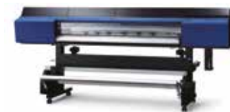
TU4-64 [für VG2-640] TU4-54 [für VG2-540] Wickelt bis zu 40 kg (88,2 lb.) auf